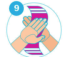
9 Séchez-vous les mains avec un essuie-mains à usage unique

SI VOUS PRESENTEZ DES SYMPTOMES DE FIEVRE, SENSATION DE FIEVRE, TOUX, DIFFICULTES RESPIRATOIRES : COMPOSEZ LE 15 - CENTRE SAMU