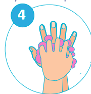
4 Les doigts entrelacés