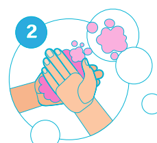
2 Paume contre paume