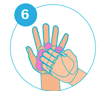
6 Au niveau des ongles