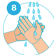
8 Rincer vous bien les mains