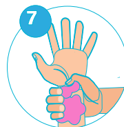
7 Au niveau des poignets