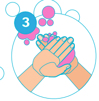
3 A l'arrière des mains